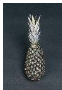
Verde ou verdoso